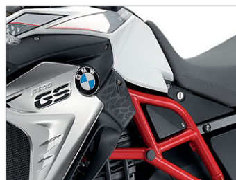
BMW F 800 GS Sondermodell GS Trophy Lightwhite uni NB5 / Sitzbank schwarz/grau (Rahmen und Feder des Federbeins Racingred uni)