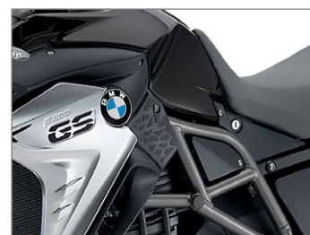
F 800 GS Exclusive Blackstorm metallic ND2 / Sitzbank schwarz/grau *3 (Rahmen in Achatgrau metallic matt / Feder des Federbeins weiss)