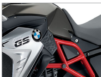
Ostragrau metallic matt N50 / Sitzbank schwarz/grau *2 (Rahmen und Feder des Federbeins Racingred uni)