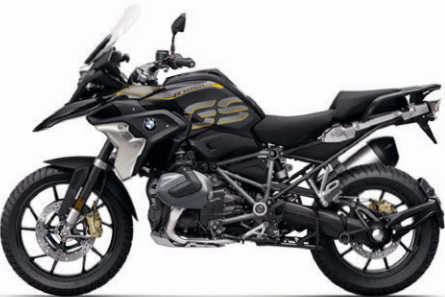
R 1250 GS Exclusive Blackstorm metallic / Nachtschwarz uni matt N2R / Sitzbank schwarz *4 (Bremssättel gold eloxiert / Antriebsstrang Schwarz matt)