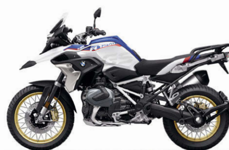
BMW R 1250 GS HP Lightwhite uni / Racingblue metallic / Racingred uni N2E / Sitzbank Motorsportfarben *3 (Bremsättel gold eloxiert / Antriebsstrang Schwarz matt)