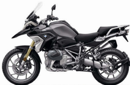
Blackstorm metallic ND2 / Sitzbank schwarz (Telegabel goldfarben eloxiert / Lenker, Antriebsstrang und Hauptrahmen Silber)

Die neue BMW R 1250 GS ist voraussichtlich ab 13. Oktober 2018 beim BMW Motorrad Partner erhältlich.