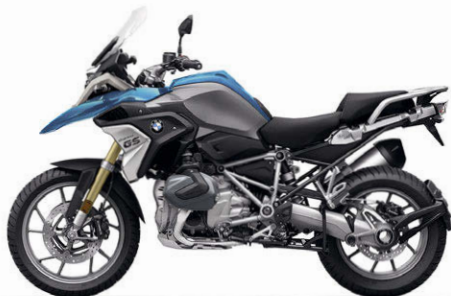
Cosmicblue metallic N05 / Sitzbank schwarz *2 (Telegabel goldfarben eloxiert / Lenker, Antriebsstrang und Hauptrahmen Silber)